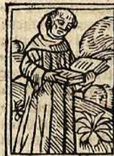
De ſancto Vena confeſſore. Caſ. xliij.

tiani z maximiā imperatorū. ¶ Qui ex nobili egyptiorū puincia ortus ſub duce agricolao terreno regi militans: deide milite tēporali renūcians: ſe cetera cōuerſatione in heremo militauit. ¶ Cū autē impator natalitia celebraret: z dñs ab oī populo immolareſ ad vrbē venit: z ingreſſus theatrum dñi idola execraret: z ſe xpianū libere profiteret: tētus eſt a preſide: z pyrro duci torquendus traditus eſt: qui primo eū in cuſtodiā v̄qz maue cluſit. ¶ Celebratis v̄o feſtis gentiliū. ¶ Venā eductū ſacrificare nolentē extendi fecit: z neruis taurinis: ac bubalinis: atqz virgib? duritiſſime cedi mādauit: deinde iſm in equole leuari: z vngulis laſnari ac lapidibus ad latera appoſitis inflammari: necnon cilicio madidato plagis eius conſtrici. ¶ Et deoſ carbones ignitos vulnerib? ſupponi. ¶ Et cū hec omīa patientiſſime toleraſſet: ligatis manib? ac pedib? fecit illuz p̄ tribulos trahi: donec mēbra eius diſſiparent: deinde plūbatis illū cedi mandauit: z marillas grauiter cōtundi. ¶ Et dū in oibus in cōfeſſiōe dñi pmaneret immobilitas nouiſſime iſm gladio aiauerit precepit: corp? quoqz ei? igne cōſumi. ¶ Qd̄ tñ ſurtiue a xpianis de igne ſublātū: z ca melo impoſitū angelo duce ad montē quēdā delatū: z ibidē quo de? p̄ ſuū animal oſtenderet: ſepulchrum eſt baſilica deſup edificata. ¶ Proceſſu autē tēporis ipſum ſanct? corp? conſtantinopolim tranſlatū: ibiqz honoriſice conditū eſt. ¶ Paſſus eſt autē ſanctus martyr. iſ. idus nonēbris.