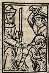
De ſancto Vena mar- tye. Caſ. xlviii.

Venas mar- ty? i ſcytia metropoli p̄brigie ſa- lutarie paſſus eſt tēpore Diocle-