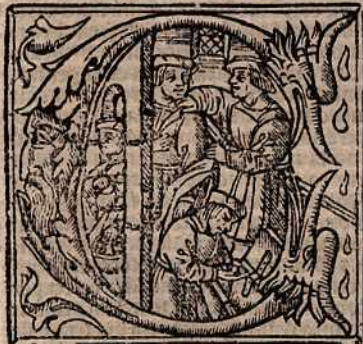
premissis hui; sacrosctē institutiōis hora r̄ ma seria: tangitur eius modus r̄ circumstantia. Uñ

Sacerdos nō d̄y genu flectere do nec p̄secra tiōis my sterium sit perfectum.