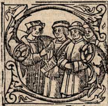
Sacerdos tribus se p̄parat.

Et tur ter- tia par- ticipa- hu- ius sc̄e ptis mis- se: q̄ fm dñm̄ Al- ber. ē p̄ paratio qua ite- rim ad offeren- dū & cō- secrādū se p̄pa- rat sacerdos. ¶ Preparat autē se tribus. s. incēso: lotione & ofone. Incēso se p̄parat deuotiōis odo- re: lotione mūdiciēntiore: p̄ ofonē cordis ardo- re. Itā sacrandis muneribus p̄ subdiaconū p̄pa- ratis: & p̄ diaconū sacerdoti oblatis: p̄ sacerdotē q̄ in altaris mediō snp̄ pallas explicatas: quoz̄ ū