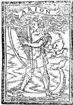
Invisis piratis enclam.

IN VIA VIRTUTI NULLA EST VIA. FATALE INVENIUNT.