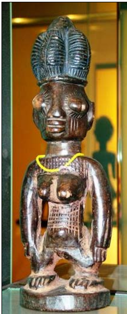
Figura 1. Escultura antropomorfa. Tribu Yoruba. Museo Arqueológico de Tenerife.

identifican su procedencia. Aunque no posee atributos sexuales, tiene los pechos muy sobresalientes y marcados, lo que quizá la relacione con alguna deidad femenina. Así mismo, la parte trasera de la figura también está trabajada, sobresaliendo la parte baja de la espalda. Como elementos meramente decorativos, la figura posee una serie de trazos o bandas horizontales y verticales realizadas a punzón situadas sobre y bajo el pecho, así como una serie de rayas horizontales sobre la corona o tocado, que son los únicos rasgos decorativos que presenta la figura. Los brazos y las piernas a su vez están delimitados de una manera ciertamente tosca, pero que cumple con la misión de separar del cuerpo ambas extremidades ( figura 1 ).