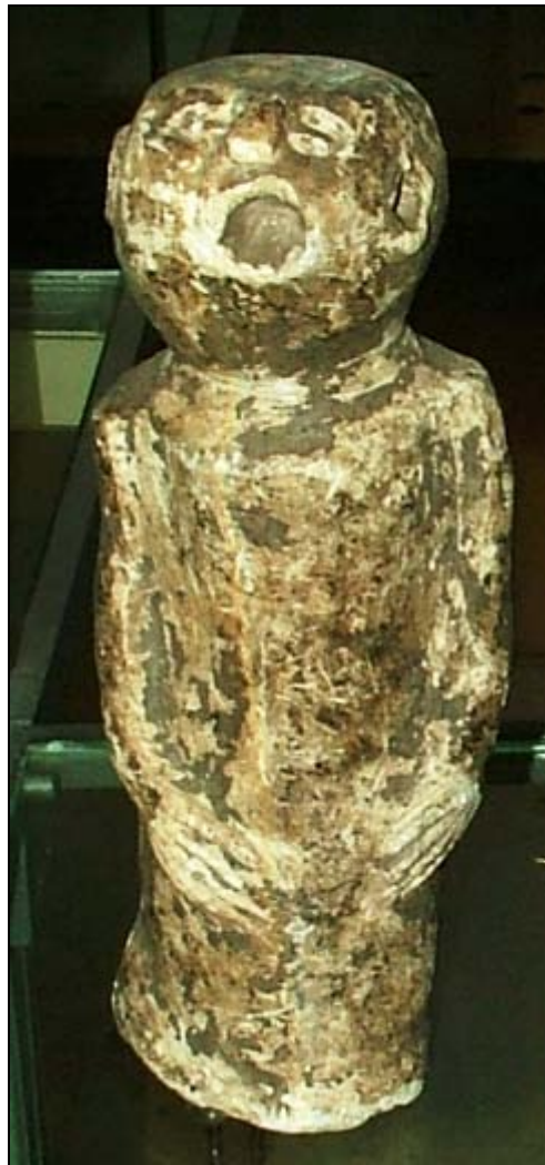
Figura 4. Escultura antropomorfa, Sierra Leona. Museo Arqueológico de Tenerife.