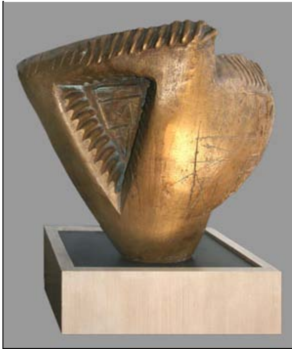
Figura 3. Adam Henri-Georges, La Caracola 1960.