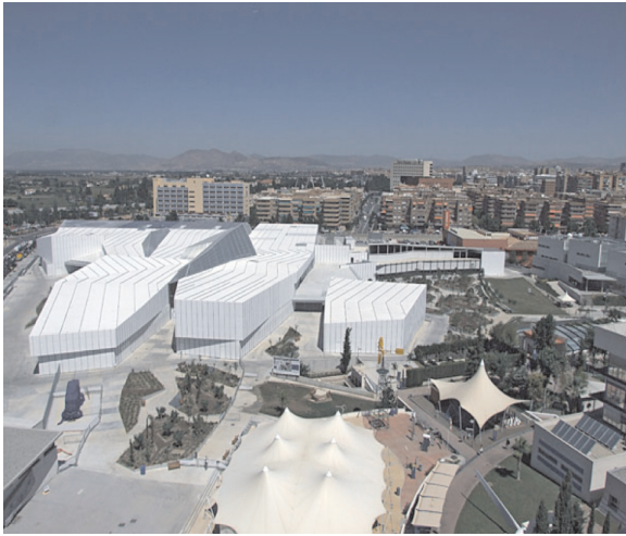
Figura 9. Vista General del Parque de las Ciencias.