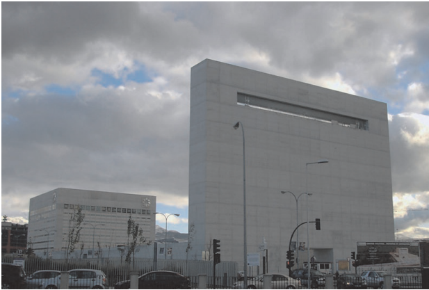
Figura 6. Edificio Pantalla.