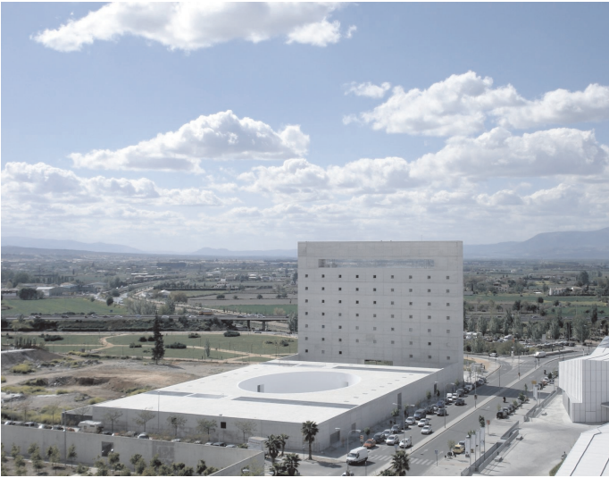
Figura 4. Centro Cultural Caja Granada.