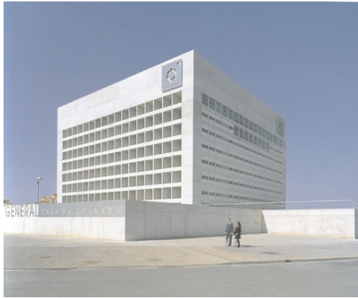
Figura 3. Cubo de la General.