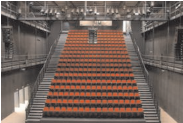
Figura 7. Teatro Isidoro Maiquez.