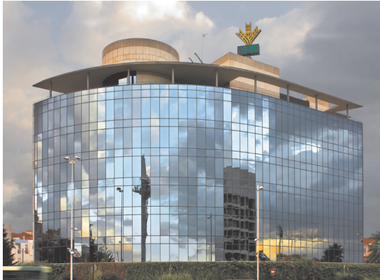
Figura 2. Edificio de la Caja Rural.

La Torre de la Caja Rural es uno de los edificios de la zona sur de Granada con una imagen más contemporánea.