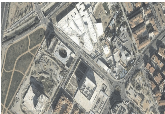
Figura 1. Vista general del itinerario.