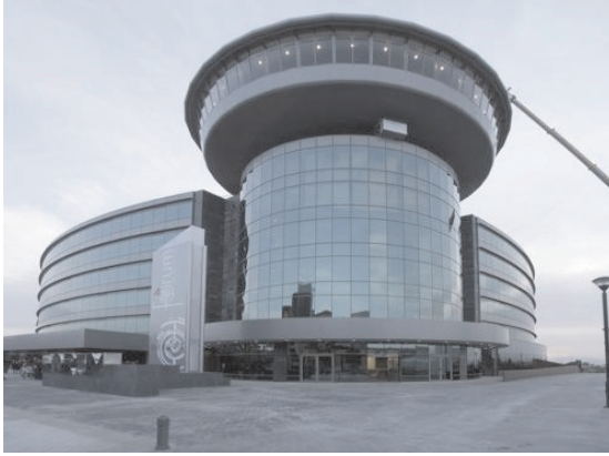
Figura 8. Edificio Fórum.

El edificio denominado Fórum de Negocios, situado junto a la autovía, queda integrado en el conjunto de edificio formado por la Torre de la Rural, el Cubo de la General y el Centro Cultural Caja Granada, y Museo de las Ciencias que conforman un lugar emblemático de la Granada del siglo XXI.