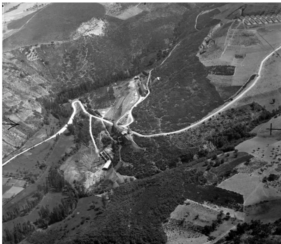
Figura 5: Panorámica del grupo minero de MSP del Coto Wagner y el poblado minero de Onamio en la que se aprecia el incipiente impacto de las escombreras y los hundimientos de las galerías (Archivo Nacional de Cataluña, Fondo TAF)

fuerte impacto ambiental (fig. 5) y la aguda desigualdad social que acompañaba el auge minero e industrial de la zona. En este sentido, cabe inscribir el redescubrimiento de la labor de las oreanas en la ribera del Sil por las que se interesarían Ramón Cabanillas y Federico Mompou en la obra musical la Aureana do Sil (1951), y más tarde José Antonio Guarriarán (1967) y Miguel Delibes (1986), y que desaparecerían a mediados del siglo XX cuando la construcción de los embalses limitó el arrastre de las masas de aluviones en los que bateaban el oro.