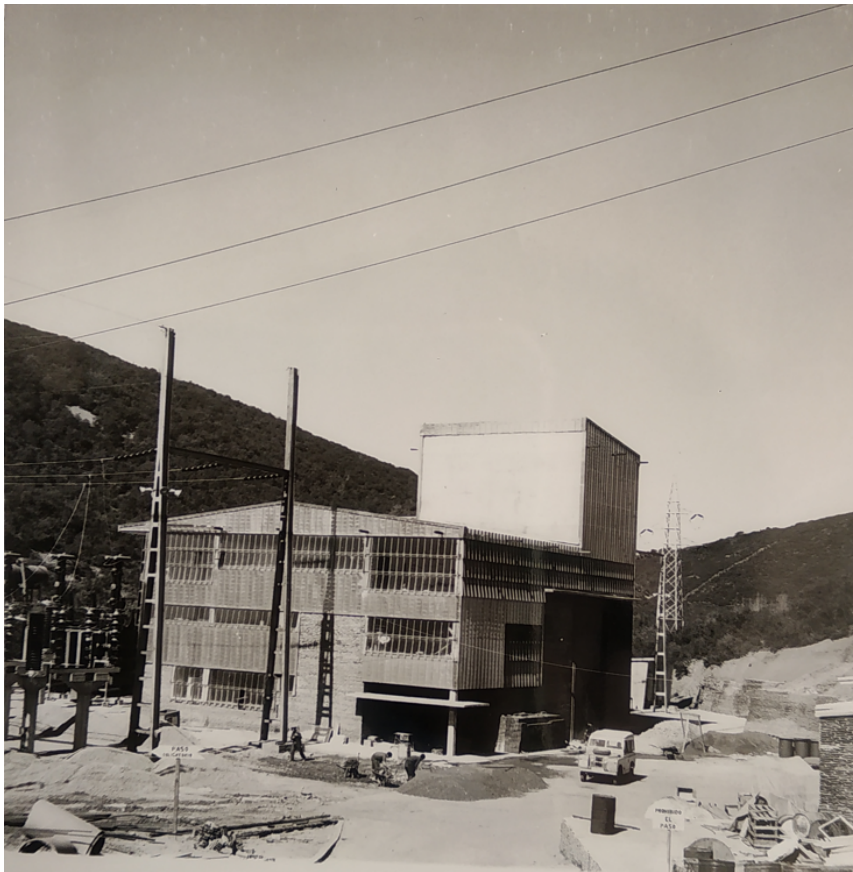
Figura 2: Central hidroeléctrica de Santa Marina, Toreno

también caracterizan algunas de las centrales de Hidrogalicia de la zona, y que dejan a un lado la expresiva sencillez del hormigón visto de la central de Bárcena (1952-1960). Cabe señalar la permanencia del repertorio historicista y vernáculo en los poblados de Eirós, Bárcena u Ondinas, donde se pueden interpretar también los principios ruralistas y antiurbanos que habrían guiado la propuesta de García Bellosillo y Esquer de la Torre para el poblado de Compostilla, destinado a cuadros técnicos y directivos, y caracterizado por amplias zonas ajardinadas y arquitecturas historicistas que reúnen referencias escorialenses, así como evocaciones al regionalismo gallego y a determinados monumentos locales. También bajo soluciones compositivas de corte clasicista se pueden inscribir las barriadas y asentamientos obreros trazados por los técnicos del Instituto Nacional de Vivienda (INV) y la Obra Sindical del Hogar y la Arquitectura (OSHA) entre 1945 a 1965. De estas propuestas resultarían algunas de las estampas características del paisaje urbano minero de la cornista noroeste, pues, a menudo, estos proyectos compartieron trazas con promociones coetáneas en las cuencas leonesas y asturianas.