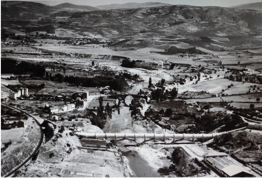
Figura 1: Sifón del Boeza en Ponferrada, 1962 (Centro de Documentación – Archivo Histórico SEPI. AF: 000524)

(1957-1963) y el azud de Peñadrada y el salto de Santa Marina del Sil (1948-1957). La escarpada orografía exigiría la construcción de túneles, taludes y acueductos, si bien varios tramos exteriores del canal nº1 tuvieron que ser sustituidos a finales de la década de 1970 por los severos daños que presentaban.