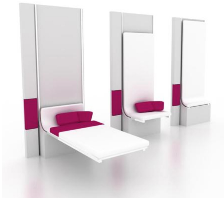
Figura 5: Centre Hospitalier Régional Universitaire de Lille, Francia. Cama de acompañante escamoteable

Aunque en el límite de estos planteamientos se podría llegar a diseñar un hospital paramétrico, su aplicación progresiva a todas las instalaciones, a la estructura y al mobiliario es ya un hecho en edificios de nueva planta, y se tiende a introducirlo a distintos niveles en la adaptación de centros existentes. (Figura 5)