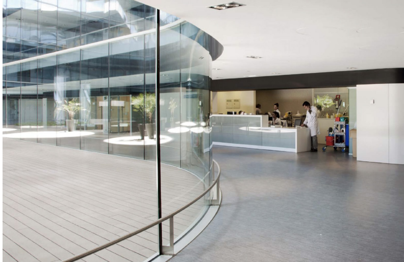
Figura 2: Hospital Rey Juan Carlos, Móstoles, Madrid

c) Se ha de potenciar la percepción del espacio a través de otros sentidos mediante la introducción de claves sonoras y táctiles. Además de las establecidas en la normativa, se pueden proponer cambios de iluminación que se acompañen de un cambio de textura en el pavimento, así como cambios en los materiales que tengan una distinta absorción del sonido.