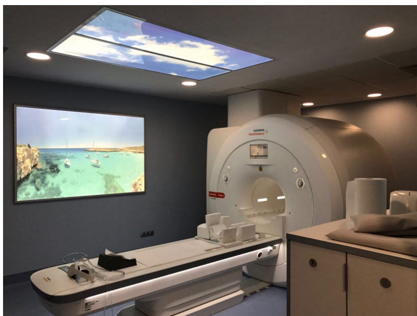
Figura 6: Hospital Sant Joan de Déu, Palma de Mallorca, Unidad de diagnóstico por la imagen

Las recomendaciones resultantes afectan a tres grupos de acciones: 1/ a los procesos, detectando posibles fallos; 2/ a los principios de diseño, identificando los elementos críticos; y 3/ a la cultura de la seguridad y el bienestar, especialmente -pero no sólo- centrada en el paciente. (Figura 6)