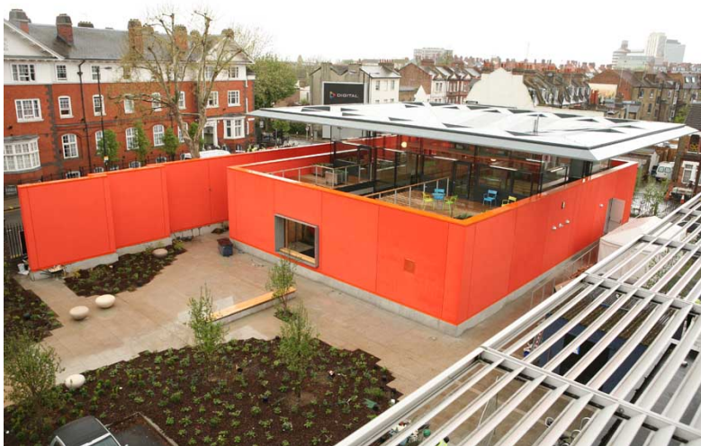
Figura 7: Maggie's West London Centre

Entre las primeras se encuentran las salas de espera activas, los huertos terapéuticos y los jardines y parques de juegos para niños hospitalizados; también se está introduciendo la posibilidad de desarrollar o asistir a actividades artísticas o de ocio, tales como conciertos o representaciones teatrales.