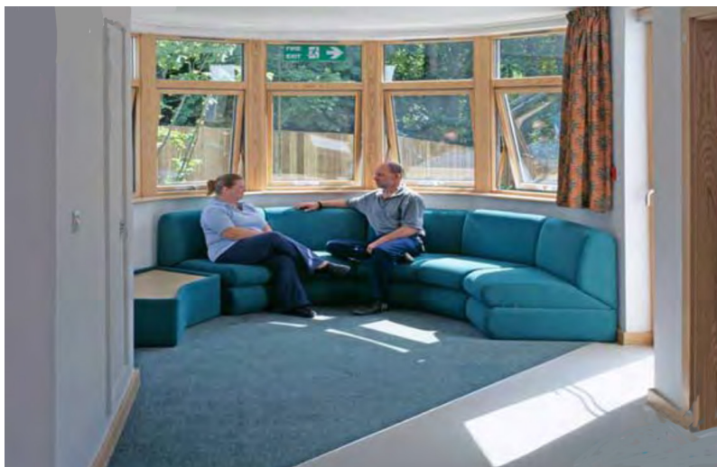
Figura 3: Woodhaven Mental Health Unit, Southampton, Reino Unido

d) Hay que establecer un uso adecuado de los colores, los acabados y los materiales, teniendo en cuenta que afectan al estado de ánimo; hay que evitar deslumbramientos y brillos, prestando especial atención a la ubicación y el diseño de las ventanas, disponiendo mecanismos de matización y oscurecimiento, y permitiendo que los usuarios tengan acceso a ellos. (Figura 3)