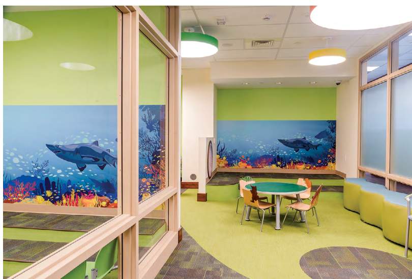
Figura 4: Lehigh Valley Health Network Green, Pensilvania, Unidad de pediatría

La sostenibilidad del conjunto del edificio y de sus servicios es otro aspecto fundamental que afecta al modo de habitar un hospital y a la salud de sus usuarios. Teniendo en cuenta que los usuarios de los hospitales pasan hasta el 90% del tiempo en espacios interiores, y que en ellos la concentración de contaminantes alcanza niveles hasta cinco veces más altos que en el exterior, hay que evitar el uso de materiales que contengan compuestos químicos nocivos. (Figura 4)