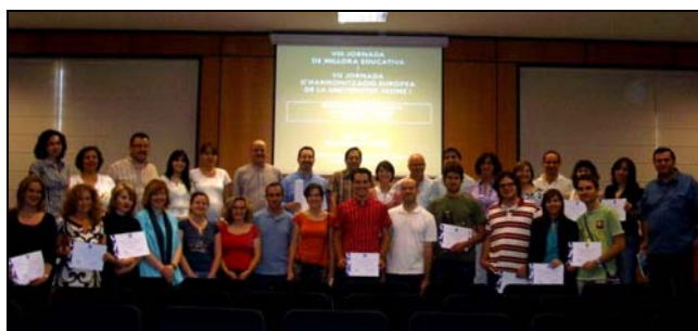
Figura 1: Acto de entrega de diplomas de Capacitación para la Docencia Universitaria (formación de noveles) en la VIII Jornada de Millora Educativa i VII Jornada d'Harmonització Europea de la Universitat Jaume I.

Estos primeros proyectos han sido presentados en la VIII Jornada de Millora Educativa i VII Jornada d'Harmonització Europea de la Universitat Jaume I de Castellón [1][2], mayo 2009, donde también se hizo entrega de los diplomas de Capacitación para la Docencia Universitaria a los profesores noveles que completaron su formación en los cursos 2006/2007 y 2007/2008 (figura 1).