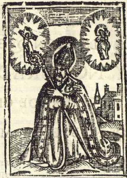
S. GREGORIO EL BETICO.