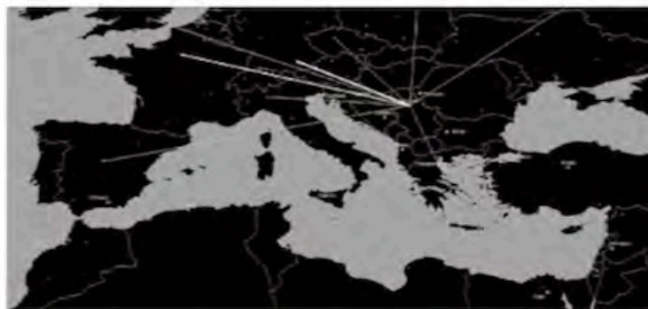
FIG. 1d/ Plano de conexiones de vuelos de la ciudad de Belgrado