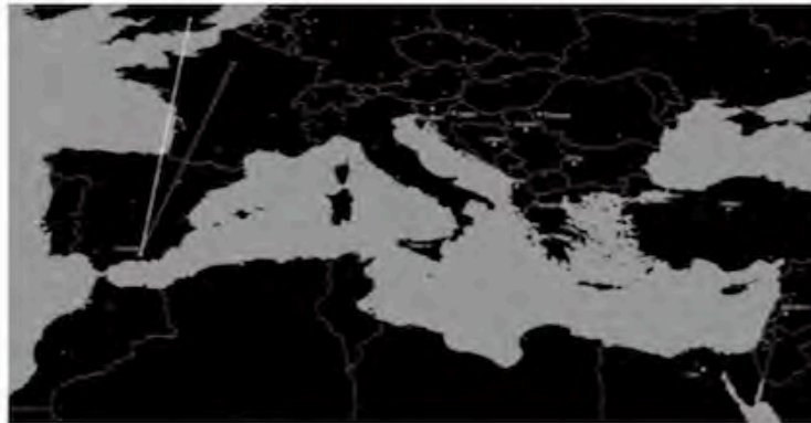
FIG. 1c/ Plano de conexiones de vuelos de la ciudad de Granada