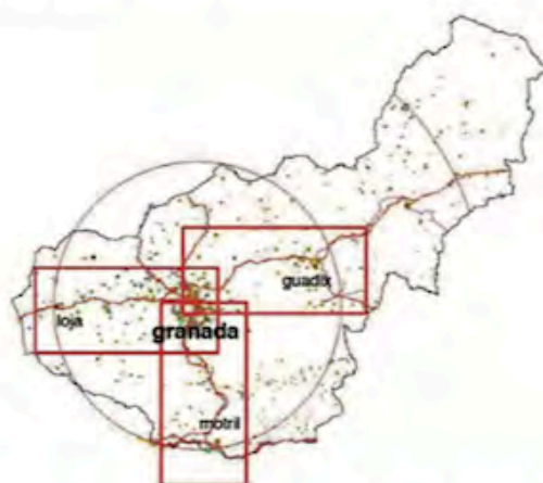
FIG. 3A/ Granada en la red regional de ciudades. Marcos territoriales de los tres ejes de desarrollo urbano Motril-Guadix-Loja

Se observa la integración de la Universidad y el Patrimonio Cultural urbano en Granada, mezclándose los campus concentrados y dispersos (rosa, cian y naranja) con el patrimonio disperso cultural y turístico (granate oscuro y claro) de la ciudad. El espacio Universitario está fuertemente ligado con el espacio patrimonial histórico y turístico de la ciudad. Además, la Universidad se ha convertido en la institución pública con mayor capacidad para regenerar, dinamizar y activar el patrimonio histórico abandonado de mayor envergadura de la ciudad, ya sean grandes contenedores o conjuntos urbanos (antiguos edificios militares, barrios, palacios árabes...).