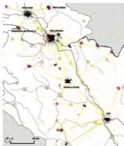
FIG. 6/ Universidad de Belgrado en relación con otros centros universitarios y culturales en Serbia

Los Equipamientos universitarios se distribuyen de manera dispersa en el espacio. La mayoría de las facultades se concentran en el centro de la ciudad, ligándose a las partes importantes de la ciudad histórica y su patrimonio. (Color rojo —facultades; color azul— otros equipamientos universitarios; color rojo oscuro- zonas espaciales de patrimonio cultural).