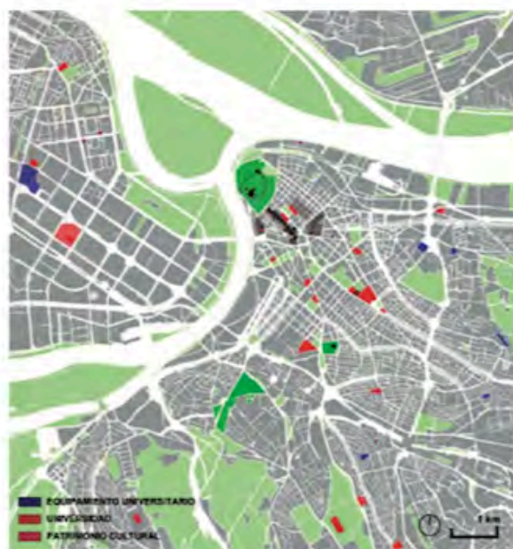
FIG. 5/ Belgrado, centro cultural y centro universitario