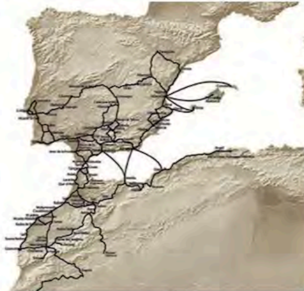
FIG. 4/ Granada en las redes de ciudades de valor y atracción cultural. Ejemplo del Itinerario cultural de la Ruta de los Almorávides y Almohades

Se muestra la posibilidad de crecimientos alternativos a la extensión centralizada de la capital de Granada, en la que cabe esbozar desarrollos urbanos de escala regional a través de corredores metropolitanos multicentro. La nueva polaridad emergente en los extremos de Loja, Guadix y Motril, sugiere crecimientos a través subsistemas metropolitanos en red con usos e intensidades diferenciadas, pudiendo aumentar así la cohesión de este territorio.