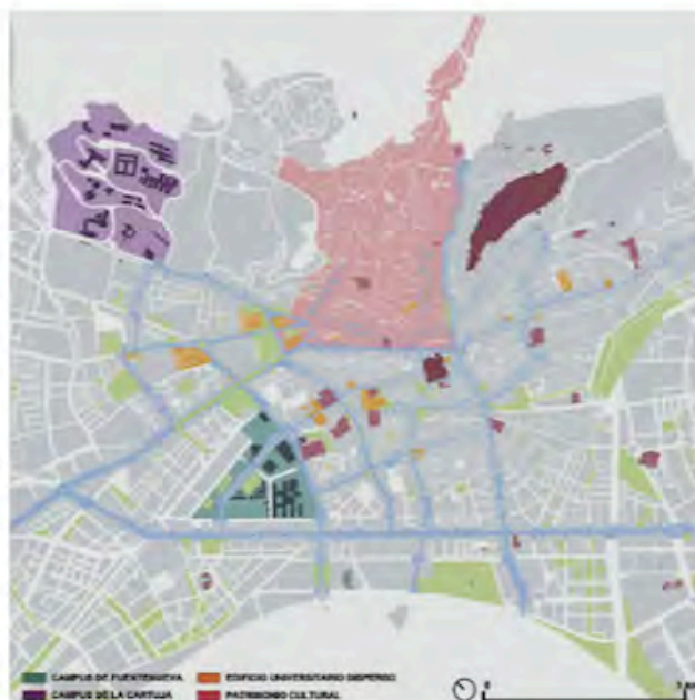
FIG. 2/ Granada. Relación entre Universidad y Patrimonio Cultural Urbano