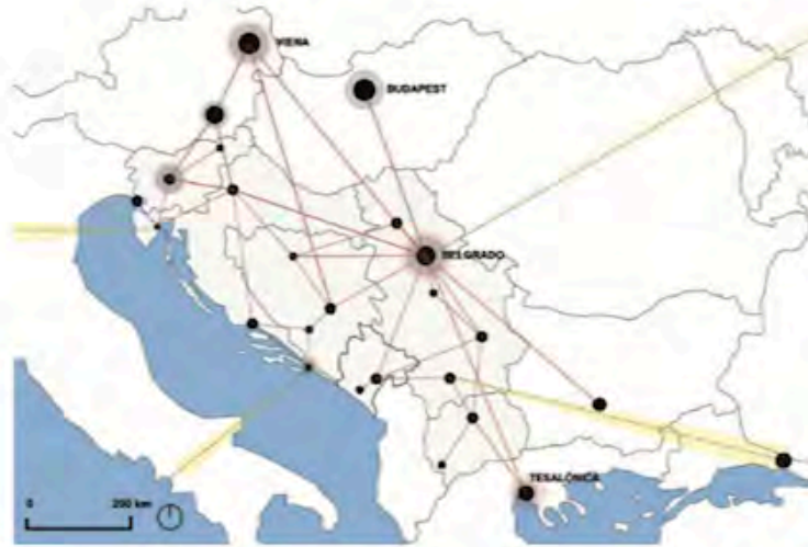
FIG. 7/ Red formada por centros universitarios existentes en el territorio de antigua Yugoslavia y por centros europeos con mayor impacto en el desarrollo de la enseñanza universitaria en Belgrado y Serbia, desde el siglo XIX hasta la actualidad. La red incluye las distintas direcciones de influencias culturales durante del pasado