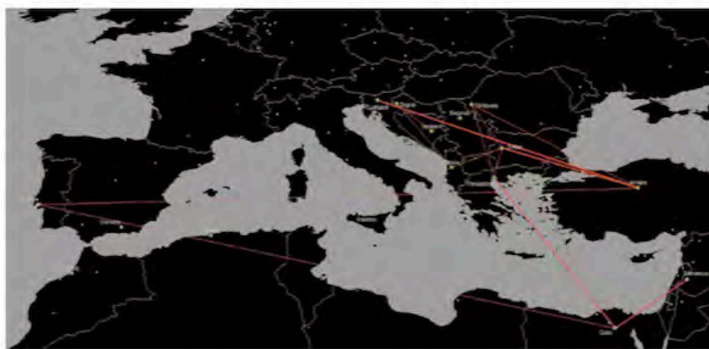
FIG. 1B/ Plano de conexiones de aerolíneas, con origen/ destino en ciudades mediterráneas

Se comprueba que entre las ciudades mediterráneas hay muy pocas conexiones directas entre ellas (rojo), en comparación con otras conexiones hacia otras ciudades no mediterráneas (blanco), casi todas hacia los hubs centro y norte europeos.