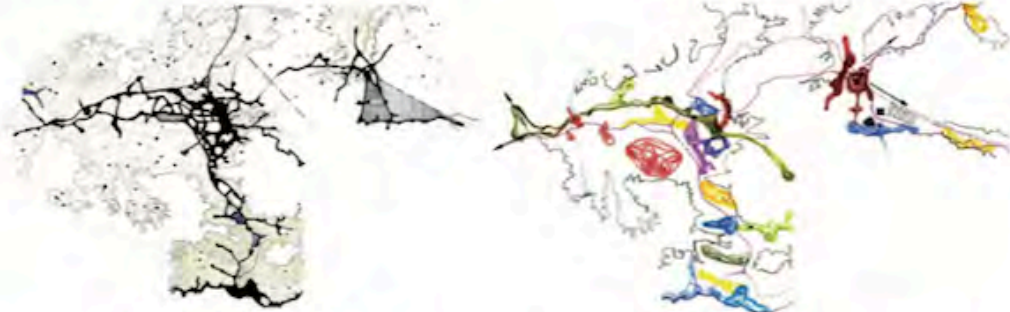
FIG. 3b/ Granada en la red regional de ciudades. Red de corredores urbanos regionales y sistemas metropolitanos locales