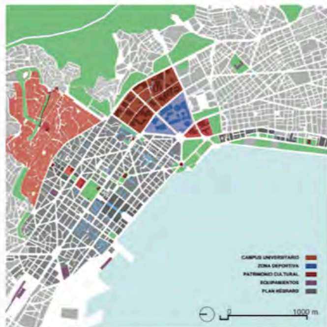
FIG. 8/ Historia y cultura. La ciudad de Tesalónica, perteneciente a Grecia desde 1912, ofrece la huella ejemplar del plan de 1917, de E.Hébrard, A. Papanastasiou, Th.Mawson, A.Zachos y K.Kitsikis. Además de la espléndida trama de calles y plazas, se derivan del mismo el campus universitario, el White Tower Park y el espacio para la Feria Internacional. El plan, en palabras de Alexandra Yerolympos es «expresión de la dinámica y las limitaciones de la modernización espacial y la transformación social en Grecia, durante la primera mitad del s. XX»