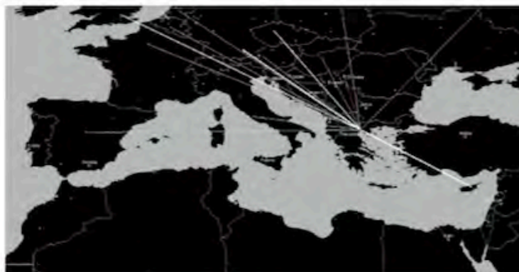
FIG. 1e/ Plano de conexiones de vuelos de la ciudad de Tesalónica