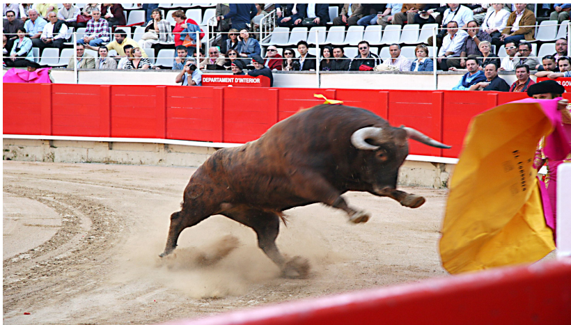
Fotografía 1. Corrida de toros.

entender sus vivencias y, consecuentemente, interpretarlas de manera correcta; es decir, en el mismo sentido de las intenciones y sensaciones que ellos las habían vivido. La mirada en el análisis de la fotografía proyectada en esta situación argumentativa estuvo orientada por preguntas como ¿qué piensan o sienten los personajes de la imagen?, ¿por qué se hizo esa fotografía?, ¿qué razones llevaron a elegir esa imagen entre todas las existentes en un álbum? Esto fue lo que sucedió en la sesión en la que Mar presentó fotografías sobre España. Ante la fotografía de una corrida de toros, tuvo lugar la siguiente interacción: