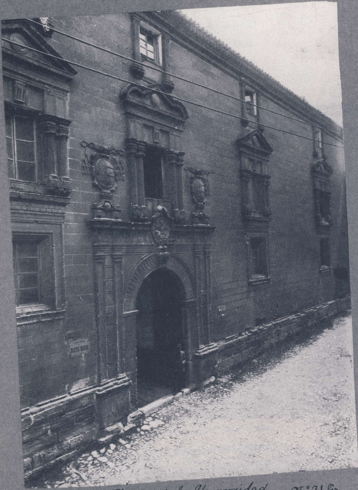
Fachada de la Universidad 36° 71' 60"