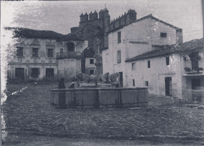
Plaza del Pueblo y fuente con león herido de Castulo N.º 230