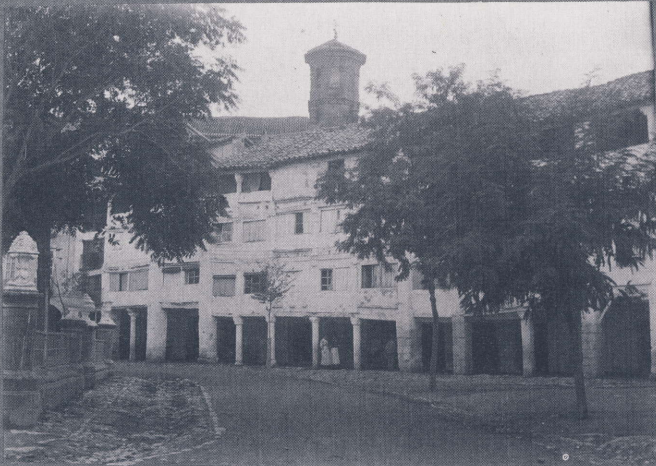
Hostal y casas de carácter monaco N.º 231