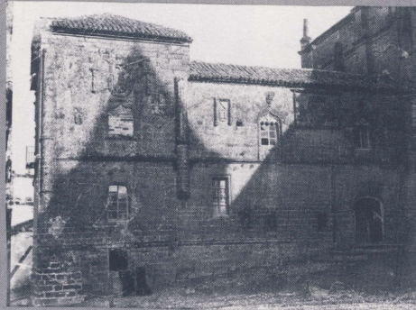
Antiguas Casas Conventuales N.º 274