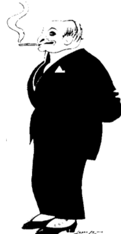
Ilustración n° 2. Emilio Montalvo Jiménez. Reflejos , 1926