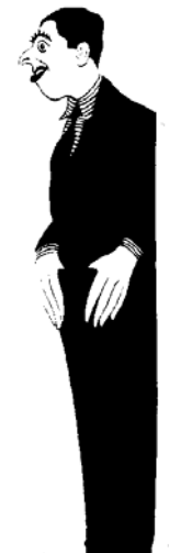
Ilustración nº 4. Juan José Santa Cruz. Reflejos, 1925