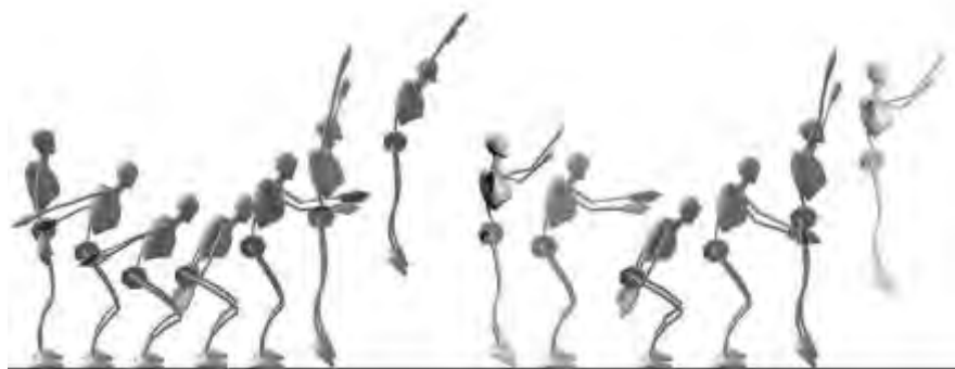
Figura 1. Representación gráfica del modelo utilizado para realizar los dos saltos verticales máximos consecutivos.