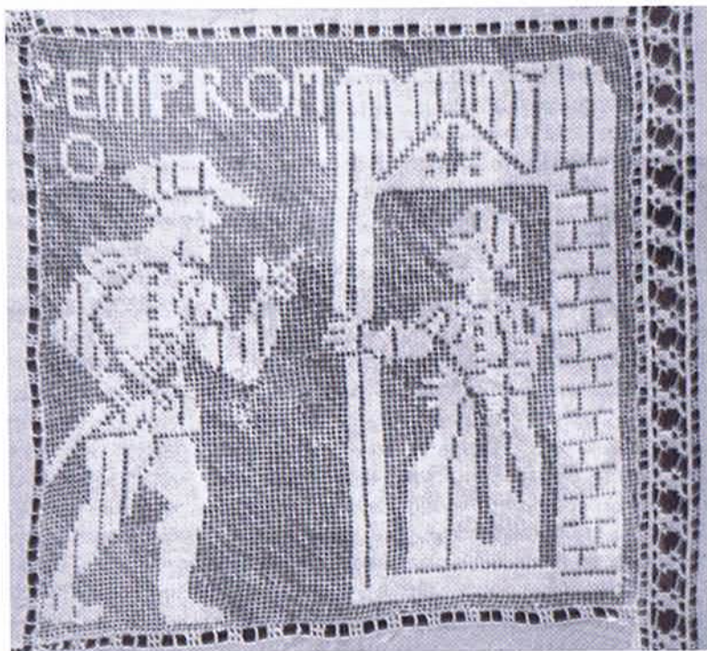
Cobertor portugués de comienzos del siglo XVII. Museo Victoria y Alberto, Londres.

mo restrictivo y la represión produce conjeturas que tienen su base, en la mayoría de las ocasiones, en apreciaciones superficiales.