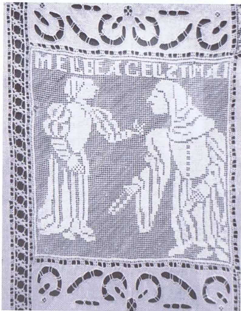
Cobertor portugués de comienzos del siglo XVII. Museo Victoria y Alberto, Londres.

Veréis cómo el poeta admira y calla, el sabio mira y piensa... Seguramente, el carbonero busca las moras o las setas. Llevadlos al teatro y sólo el carbonero no bosteza. Quien prefiere lo vivo a lo pintado es el hombre que piensa, canta o sueña. El carbonero tiene llena de fantasías la cabeza.