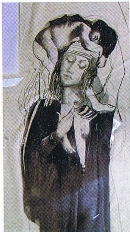
Asunción Jódar. Sin título . 2000.

MARDEN, Brice: Suicide Notes . Editions des Masson, 1974.