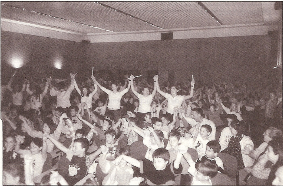
Alumnos de 4º de ESO. IES «Pintor José María Fernández». Concierto en el CEULAJ de Mollina, 22 de abril de 1999