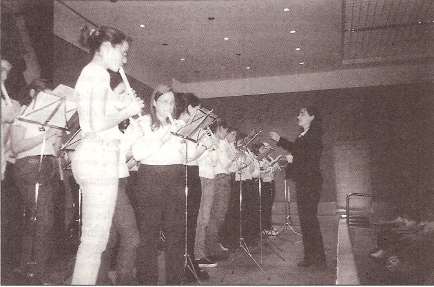
Alumnos de 4º de ESO. IES «Pintor José María Fernández». Concierto: 22 de abril de 1999