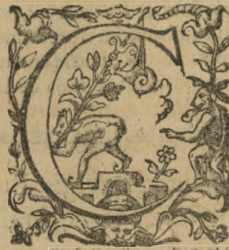
a ¶ Persecutionibus. b ¶ Philosophorum, haereticorum. c ¶ Persecutorum, vel fidelium qui expeſtabant passionis meae aduentum.

Et vita mea appropinquans erat inferno. Quia vita carnis quotidie deficiendo ad mortem tendit. Mortem enim infernum vocat, quia mors