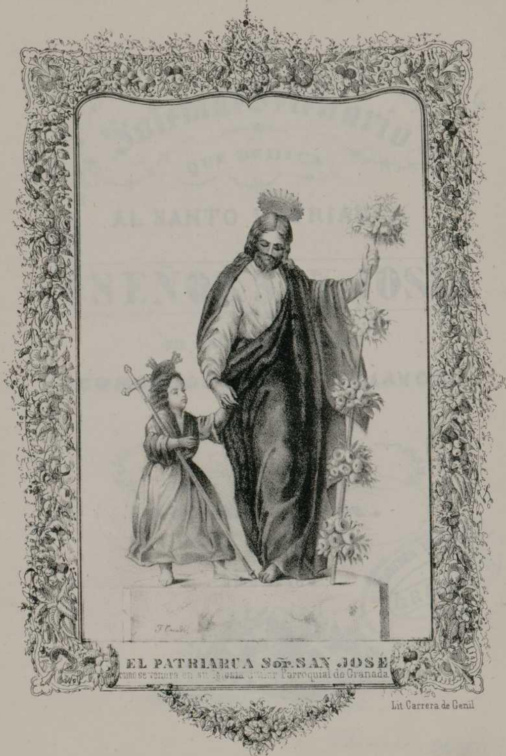
EL PATRIARCA S OR . SAN JOSE como se venera en su Iglesia Catedral Parroquial de Granada.