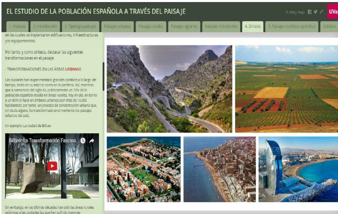
Figura 7.- Ejemplos de la visualización de la Aplicación Web (Story Map) en un dispositivo móvil.