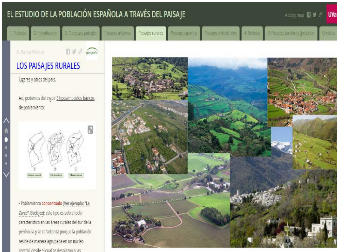
Figura 3.- Vista de la aplicación en la que se muestran ejemplos y esquemas de poblamiento rural.

Por tanto, la aplicación que hemos desarrollado, y el método que proponemos, tienen la virtualidad de ser desarrollados y adaptados para cualesquiera de los temas tratados en el currículo de Geografía de educación secundaria, proporcionando al profesor y a los alumnos una herramienta de uso relativamente sencillo, que permite incorporar todo tipo de información en los más variados soportes y formatos: esquemas, documentos, audios y vídeos, hiperenlaces, presentaciones, mapas interactivos, ortofotografías aéreas, etc. En las Figuras 3, 4, 5 y 6 incluimos algunas vistas que muestran las posibilidades de la aplicación y que recogen ejemplos diversos de los tipos de recursos y formatos que se pueden incluir. Por último, es interesante señalar que los contenidos también están disponibles para su visualización en dispositivos móviles, lo que sin duda facilita el acceso de los alumnos a los contenidos dado el intenso y frecuente uso que actualmente hacen de los smartphones (Figura 7).